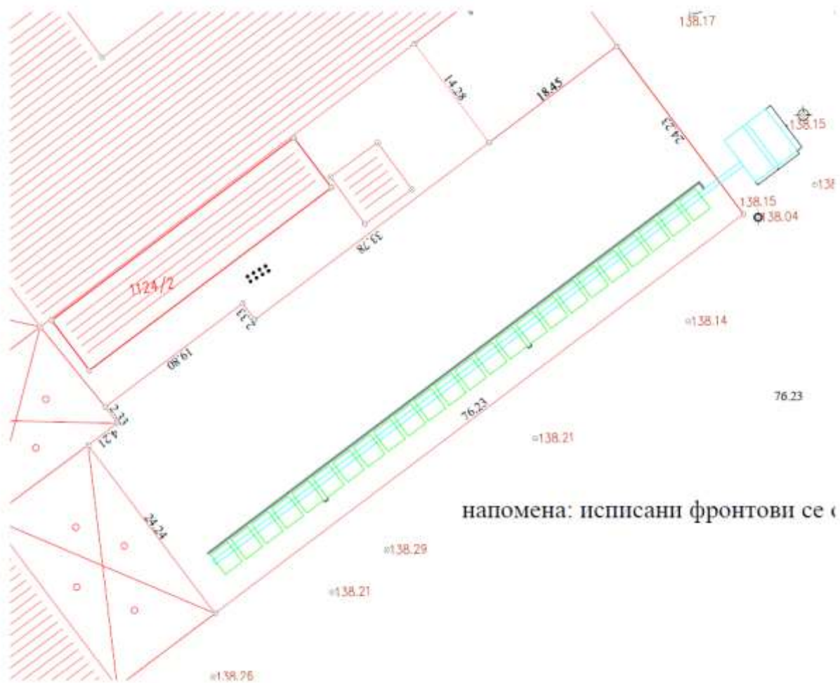
План одвођења отпадних вода из Хале 3