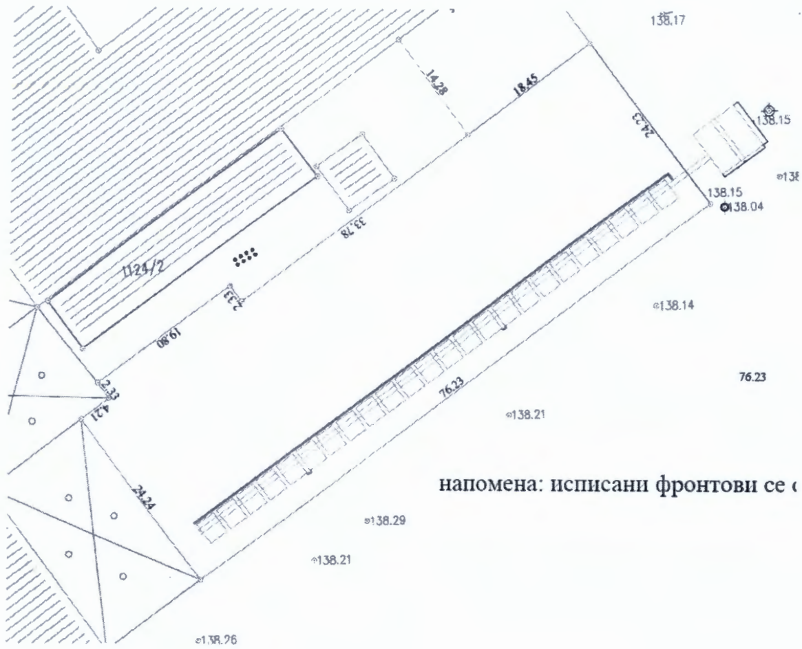
План одвођења отпадних вода из Хале 3